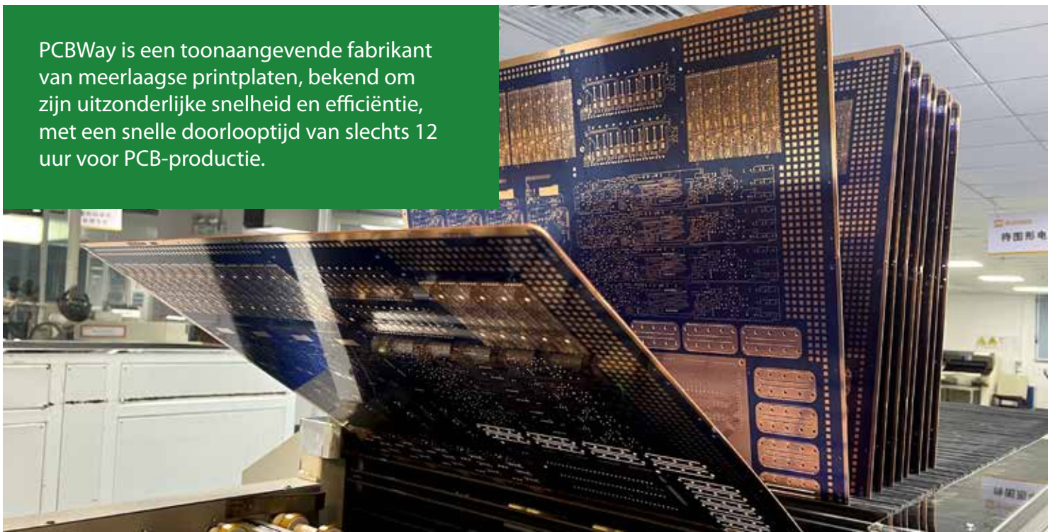
PCB-productie in actie

PCBWay is een toonaangevende fabrikant van meerlaagse printplaten, bekend om zijn uitzonderlijke snelheid en efficiëntie, met een snelle doorlooptijd van slechts 12 uur voor PCB-productie.